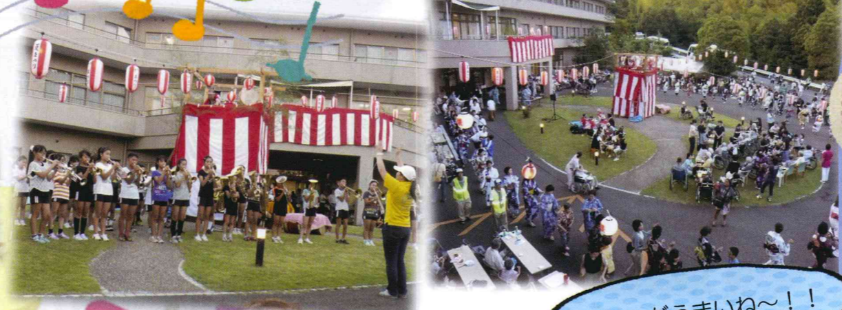
ビールがうまいね~!!