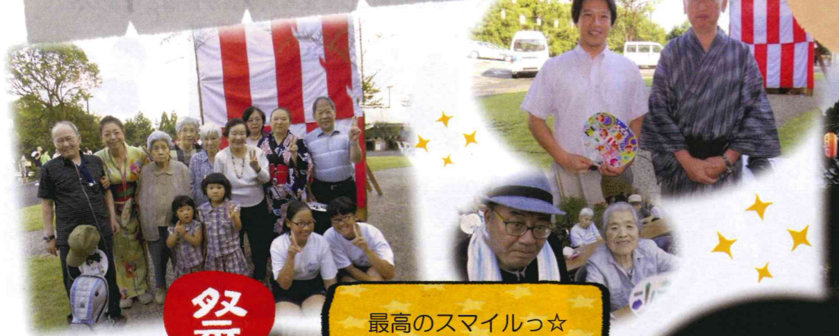
祭 最高のスマイルっ☆